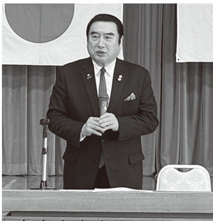
加藤会頭による挨拶