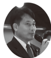
【主賓挨拶】 農林水産副大臣 滝波 宏文 様