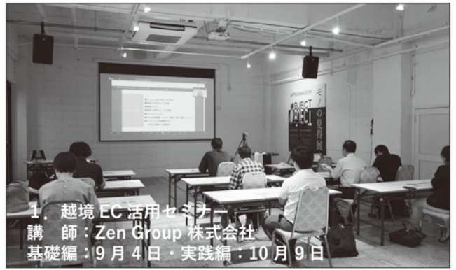
1. 越境 EC 活用セミナー 講師：Zen Group 株式会社 基礎編：9月4日・実践編：10月9日