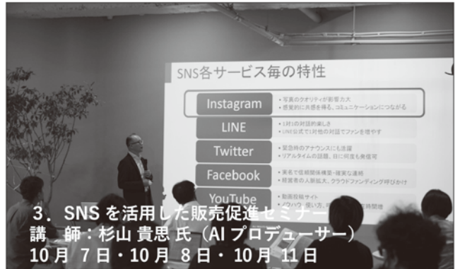
3. SNS を活用した販売促進セミナー 講師：杉山 貴恵氏 (AI プロデューサー) 10月7日・10月8日・10月11日