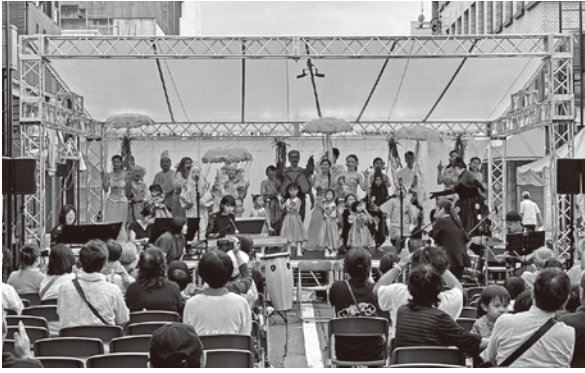
会場を盛り上げた「虹のはし合唱団」