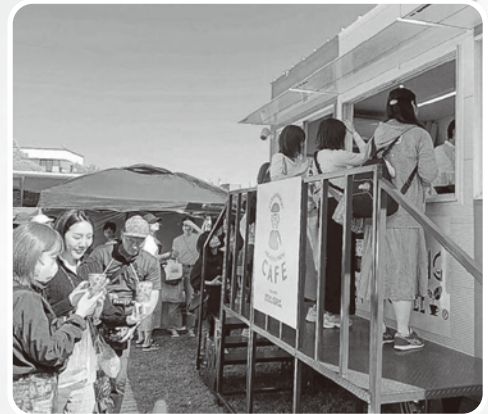
多くの人でにぎわう「めがねのまちカフェ」

鯖江市に寄付されたトレーラーハウスを活用し、人気グループEXILEのTETSUYAさんがプロデュースするコーヒー店とコラボしたカフェ「MEGANE no MACHI CAFE(めがねのまちカフェ)」が3日に、さばえつつじまつりに合わせ西山公園にオープン。