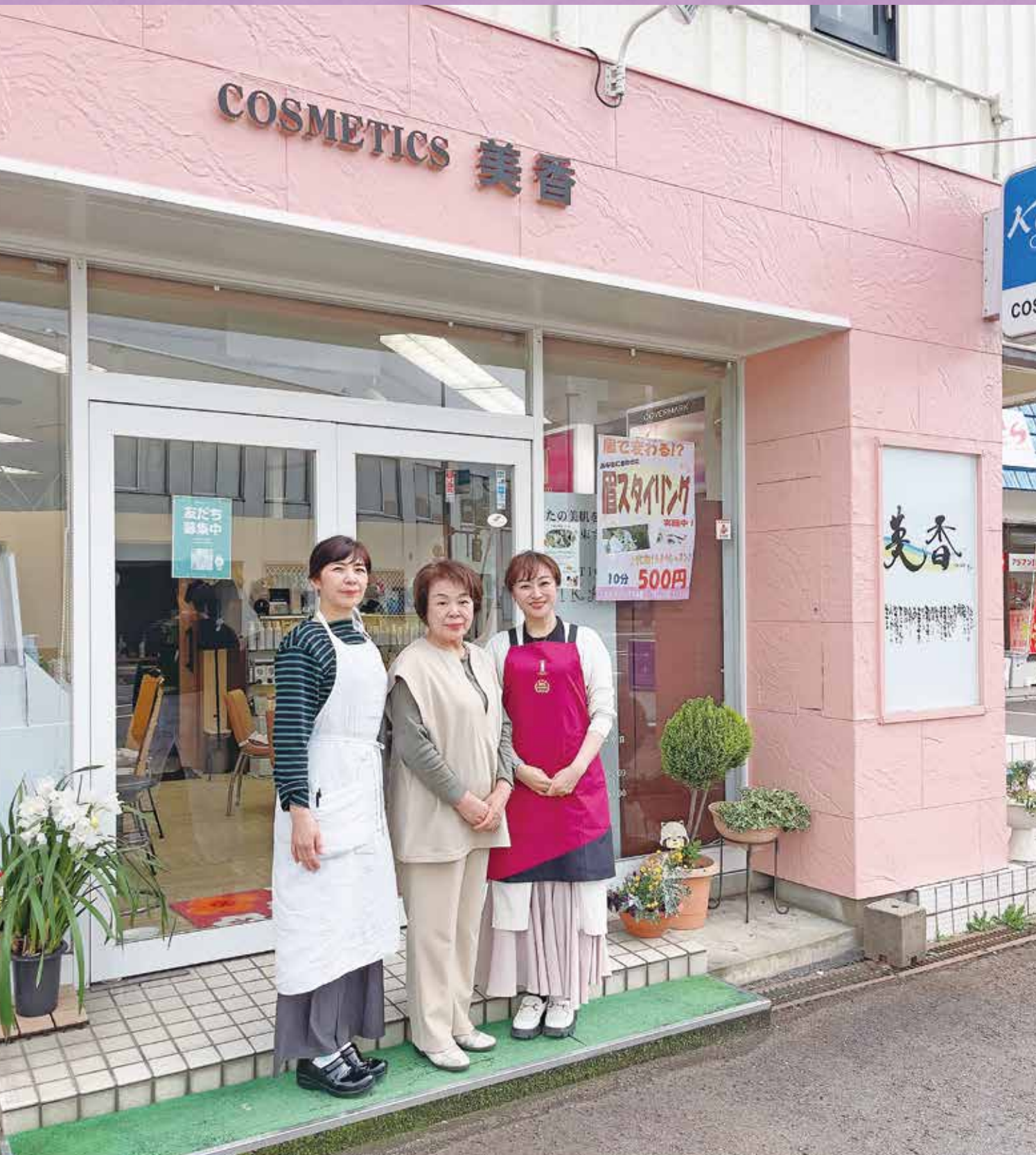
(株)コスメティックス美香 ※5P記事掲載