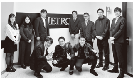
ジェットミラノにて

本視察のメインであり、「世界的な流行をも決める影響力をもつ」といわれる世界最大規模の見本市「ミラノサローネ」では、デザインの先進として名高いイタリア、ミラノの芸術性が集約されており、デザインや技術はもちろん製品やサービスの「見せ方(魅せ方)」についても新たなひらめきを得られました。また市内各地で同時開催