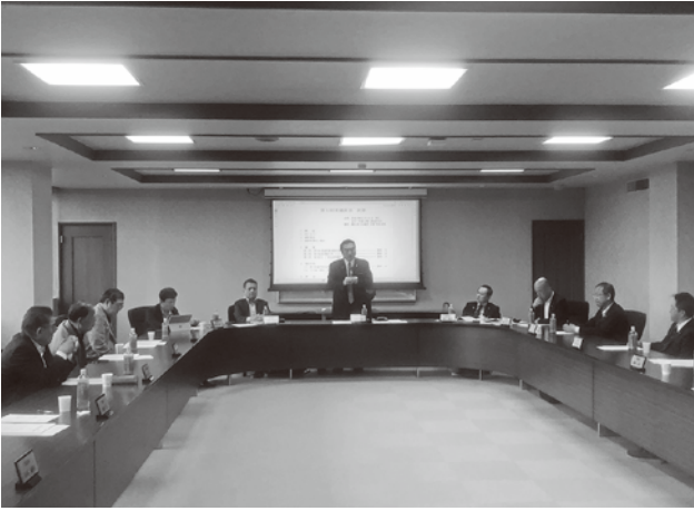
常議員会で挨拶をする会頭