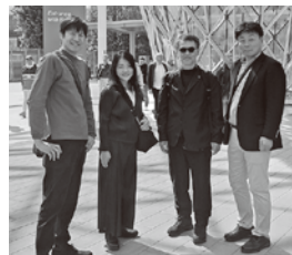
ミラノサローネにて

当所・当委員会が志す海外展示会への出展についてもイメージ創出が大いに図られました。