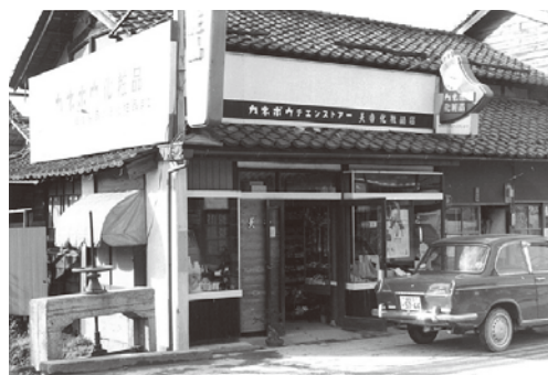
創業当時の事業所外観