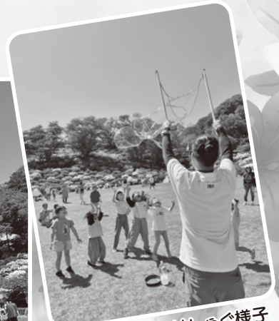
子どもたちのはしゃぐ様子